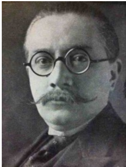
Edmond Jaloux, 1878-1949, écrivain et critique français qui collabora au Gaulois , à La Revue hebdomadaire , à Candide et aux Nouvelles Littéraires .