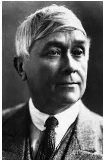
Maurice Maeterlinck (1862-1949)

(2) Maurice Maeterlinck, né le 29 août 1862 à Gand et mort le 6 mai 1949 à Nice, est un écrivain francophone belge, prix Nobel de littérature en 1911, créé comte par le roi Albert 1 er .