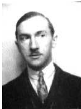
Joseph Delteil (1894-1978)

(3) Joseph Delteil est un écrivain et poète français né le 20 avril 1894 et mort le 16 avril 1978. Figure originale et anticonformiste de la littérature française, auteur d'une quarantaine de livres.