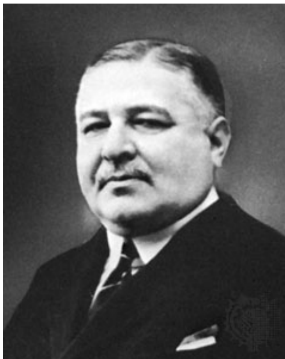
Léon Daudet (1867- 1942) Fils aîné d'Alphonse Daudet

(1) Léon Daudet est un écrivain, journaliste, polémiste et homme politique français, né le 16 novembre 1867 à Paris et mort le 30 juin 1942 (à 74 ans) à Saint-Rémy-de-Provence. Républicain converti au monarchisme, antidreyfusard et nationaliste clérical, député de Paris de 1919 à 1924, il fut l'une des principales figures politiques de l'Action française et l'un des collaborateurs les plus connus du journal du mouvement.