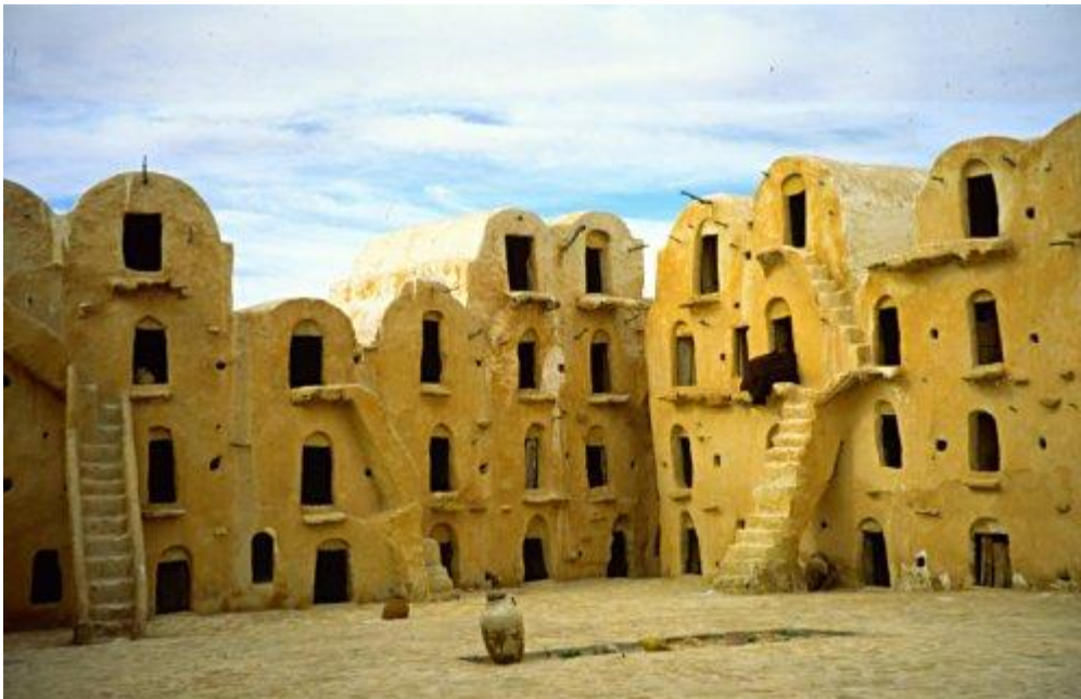
Tozeur en Tunisie

Note (1) : Tozeur est une ville du Jérid tunisien et le chef-lieu du gouvernorat du même nom. Elle compte 37 365 habitants selon le recensement de 2014. Située au nord-ouest du Chott el-Jérid, elle se trouve à 450 kilomètres au sud-ouest de Tunis. Il s'agit de l'une des oasis situées aux portes du désert du Sahara. Tozeur est une ville avec un passé religieux important et connue pour ses lettrés comme sa topographie contemporaine, parsemée de marabouts, en témoigne.