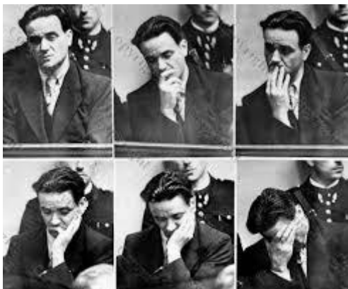
Eugène Weidmann dernier guillotiné en public en France

Note (1) : Eugène Weidmann , en allemand Eugen Weidmann , né le 5 février 1908 à Francfort-sur-le-Main, mort le 17 juin 1939 à Versailles, surnommé le « tueur au regard de velours », est un assassin célèbre des années 1930, le dernier condamné guillotiné en public en France.