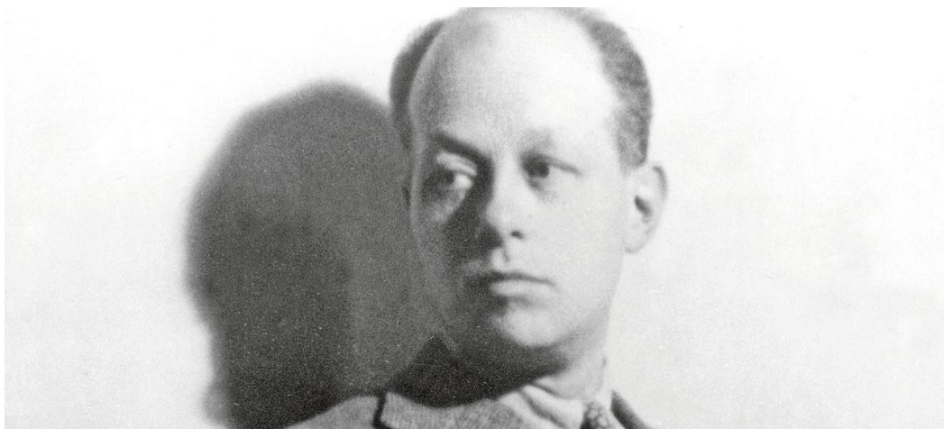
Pierre Drieu La Rochelle (1893-1945)