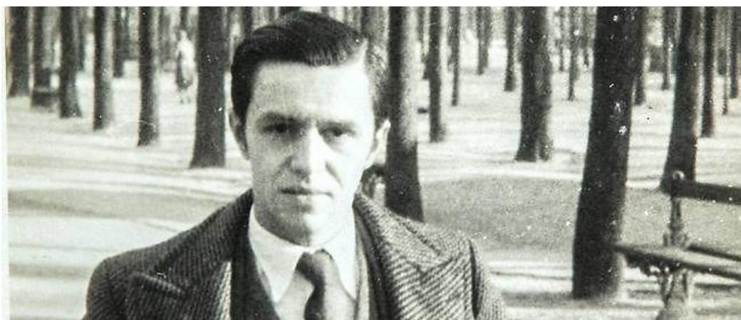
Lucien Rebatet (1903-1972) au Jardin du Luxembourg à Paris en 1931 auteur des Décombres (1942) et des Deux Etendards (1951) ooo