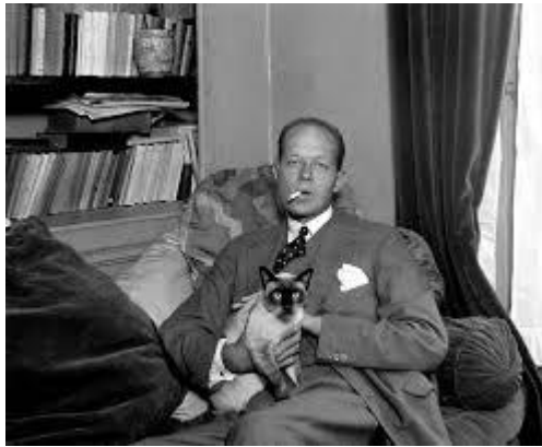
Pierre Drieu La Rochelle

Note : (1) Pierre Drieu la Rochelle , né le 3 janvier 1893 dans le X e arrondissement de Paris et mort dans la même ville le 15 mars 1945 , est un écrivain français.