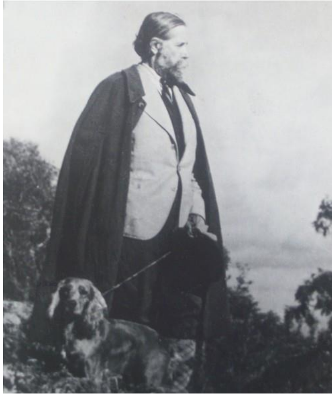
Alphonse de Chateaubriant (1877 Rennes-1951 Autriche)