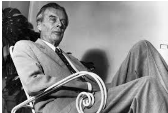
Aldous Huxley (1894-1963)

Note : (1) Aldous Leonard Huxley , né le 26 juillet 1894 à Godalming et mort le 22 novembre 1963 à Los Angeles, est un écrivain britannique plus particulièrement connu du grand public pour son roman Le Meilleur des mondes .