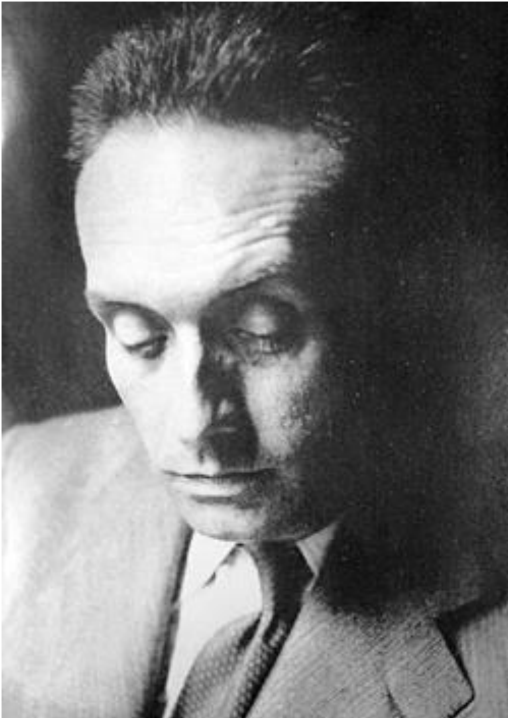
Montherlant circa 1940-1945